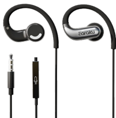
イヤホン本体×1 ※全長約1.5m